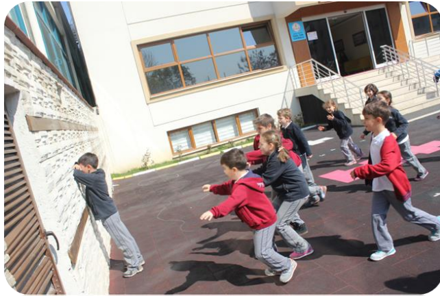
Resim 13. Öğretmen Adaylarının Çocuklara Tımbırtıp Oyununu Öğretmesi