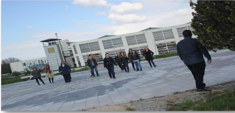
Resim 12. Tımbırtıp Oyununun Öğretmen Adaylarına Öğretilmesi

ileriye hareket etmeye çalışırlar. Ebe her tımbırtıp dedikten sonra arkasına döner ve diğerlerinin arasında kımıldayan var mı ona bakar. Eğer birisinin hareket ettiğini görürse, hareket eden çocuk ebe olur. Eğer kimseyi görmezse tekrar önüne dönüp devam eder. Amaç; ebenin arkasındaki çocukların ebe hareket ettiklerini görmeden ebenin olduğu duvara değmeleridir. Bu şekilde ilk önce ebenin duvarına yaklaşan çocuk, oyunun kazananıdır. Ancak ebe hareket ederken kimseyi görmezse, bir sonraki oyunda tekrar ebe olur (Başal, 2010).