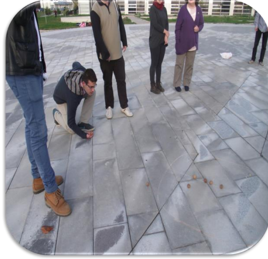
Resim 6. Ceviz Oyununun Öğretmen Adaylarına Öğretilmesi

geçer. Oyun dairenin içindeki cevizler bitinceye kadar oynanır. En çok cevizi alan kazanır (Başal, 2010).