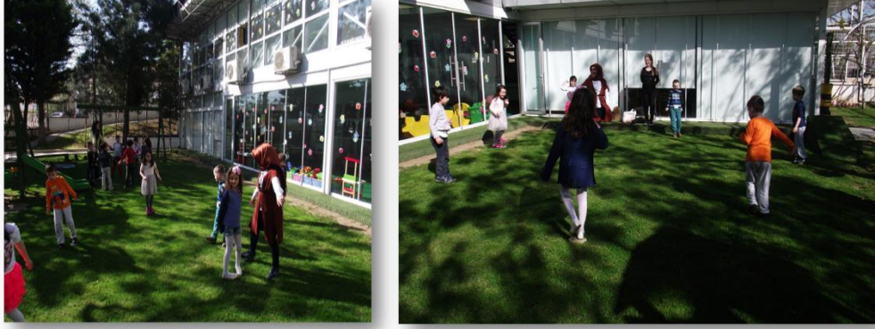
Resim 9. Öğretmen Adaylarının Çocuklara Ayağını Taştan Kes Oyununu Öğretmesi