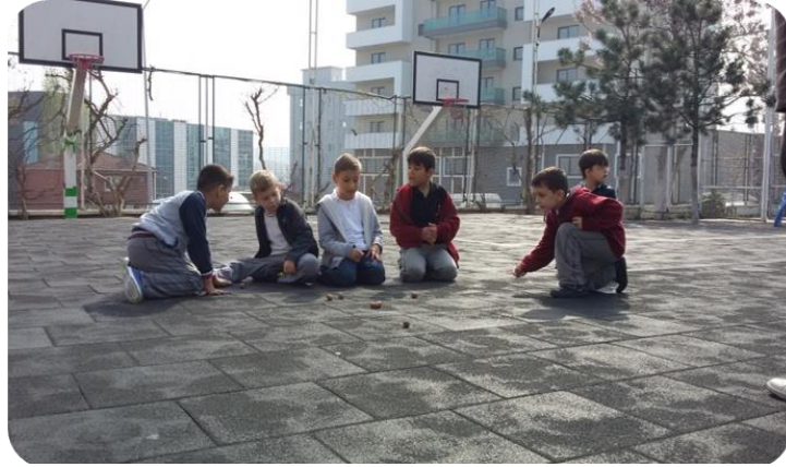
Resim 7. Öğretmen Adaylarının Çocuklara Ceviz Oyununu Öğretmesi