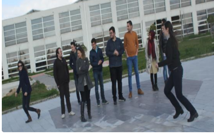
Resim 10. Kurt Kuzu Oyununun Öğretmen Adaylarına Öğretilmesi