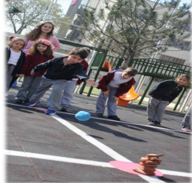
Resim 3. Öğretmen Adaylarının Çocuklara Tokuç Oyununu Öğretmesi