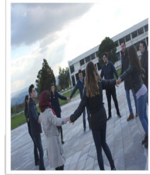
Resim 14. Yağ Satarım Oyununun Öğretmen Adaylarına Öğretilmesi