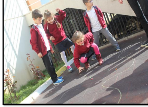
Resim 5. Öğretmen Adaylarının Çocuklara Yılan Yolu Oyununu Öğretmesi