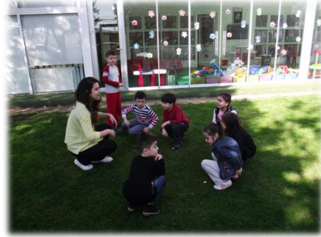
Resim 15. Öğretmen Adaylarının Çocuklara Yağ Satarım Oyununu Öğretmesi