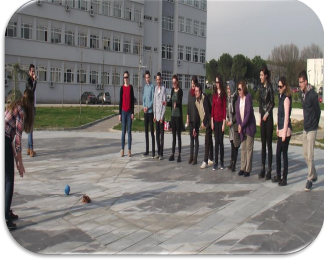
Resim 2. Tokuç Oyununun Öğretmen Adaylarına Öğretilmesi