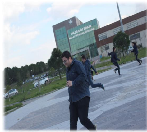
Resim 8. Ayağını Taştan Kes Oyununun Öğretmen Adaylarına Öğretilmesi