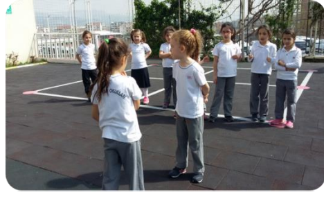
Resim 11. Öğretmen Adaylarının Çocuklara Kurt Kuzu Oyununu Öğretmesi